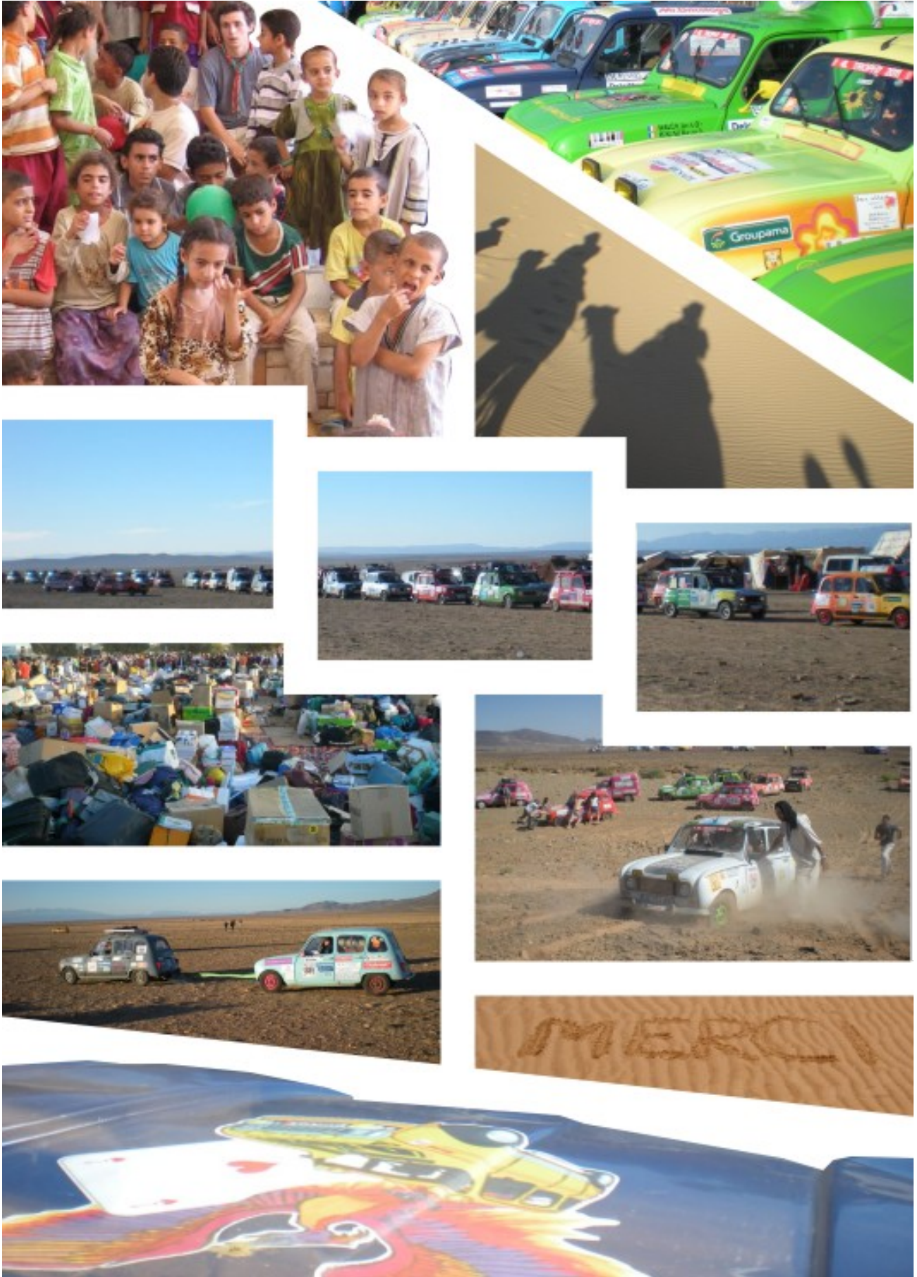
4L trop free – équipage #14 de l'édition 2017 du 4L trophy Ne pas jeter sur la voie publique